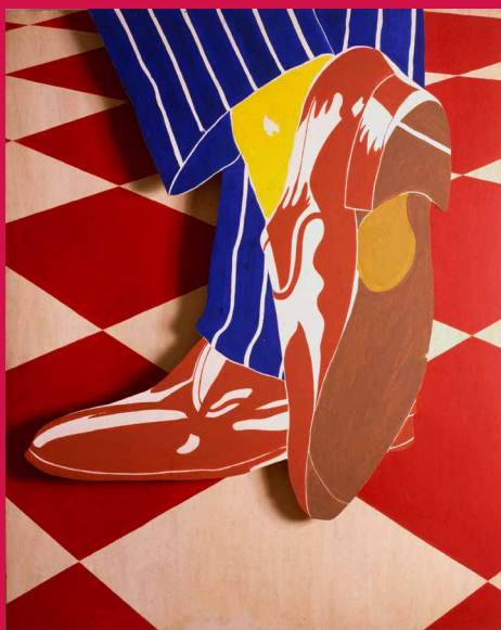
Gianni Ruffi, Riposo , 1965.

In collaborazione con Comune di Pistoia, Confcommercio Pistoia e Prato, UaPC - APS, Associazione culturale del centro storico di Pistoia. Programma completo su pistoiamusei.it