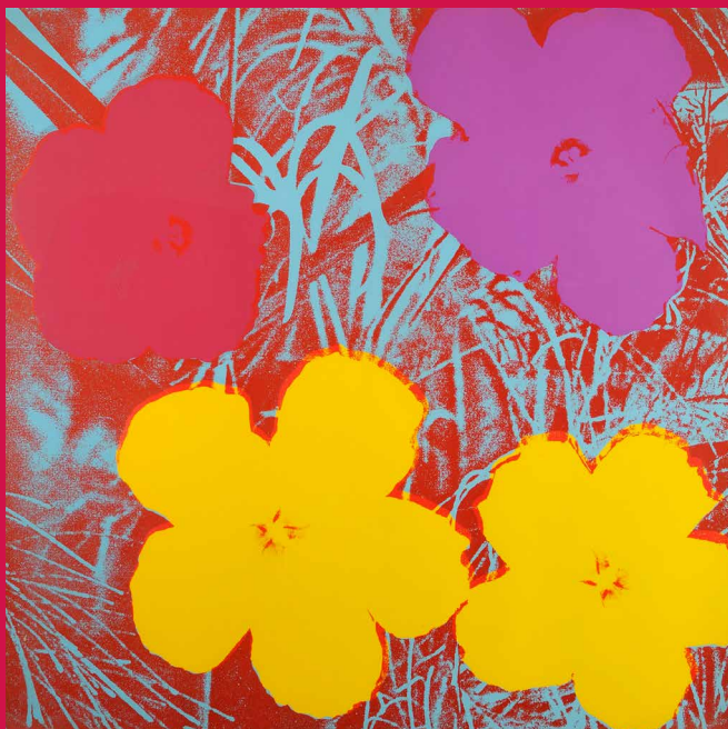
Andy Warhol, Flori (Flowers) , s.d. Collezione privata, Venezia. © ANDY WARHOL, by SIAE 2024.