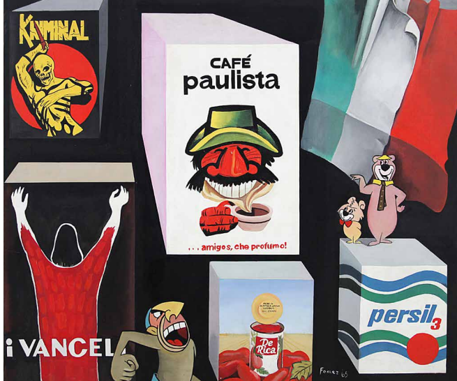
Antonio Fomez, Viva il consumo , 1964. Collezione privata

Pop Art is a typically metropolitan phenomenon: it originated in London in 1956 and developed simultaneously in New York, Los Angeles, Paris and Rome, and then spread throughout the world. In Italy, Pop Art emerged in the early 1960s, first in Rome, and later in Turin and Milan, thanks to artists who had an eye on the international scene.