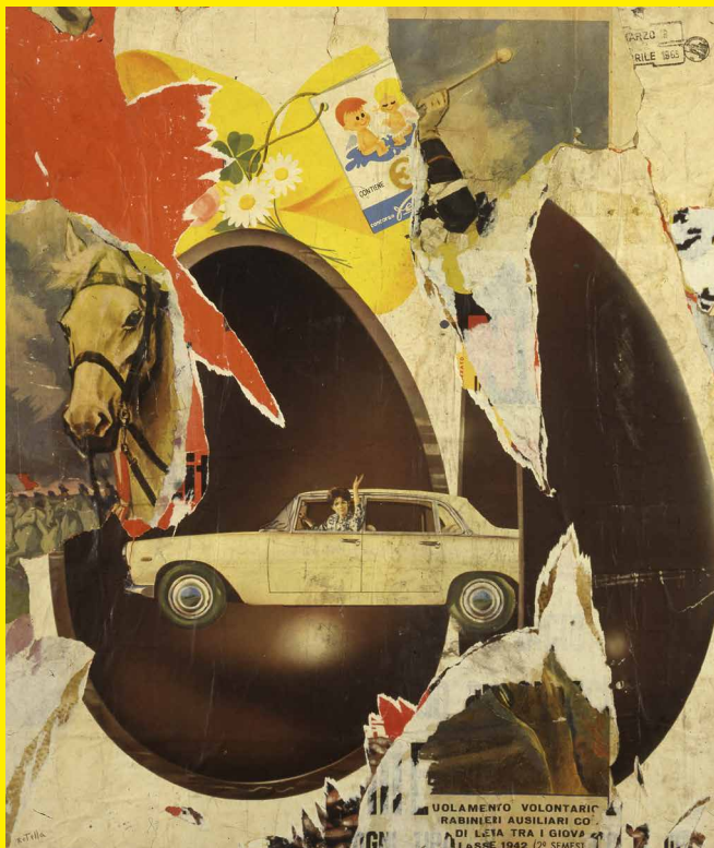
Mimmo Rotella, C'era una volta , 1963. Collezione privata, Courtesy Gió Marconi, Milano. © MIMMO ROTELLA, by SIAE 2024